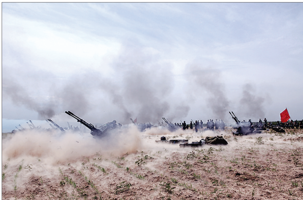
民兵双25高地分队实弹射击取得优异成绩。

一年来,公司武装部从实际出发,大力开展职工军训,推进军训成果运用,倡导复员转业军人岗位培养成才,组织民兵开展抢险应急、生产突击活动,积极服务于公司生产建设,发挥好民兵和复员转业军人骨干作用。公司先后被山西省评为国防教育先进单位,被太原市评为民兵工作先进单位、人防工作先进单位、双拥工作先进单位。