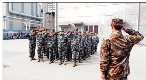
炼钢一厂以军训提升员工素质。