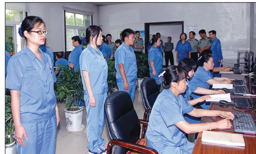
自动化公司交接班军事化。