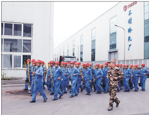
防汛应急拉动演练。