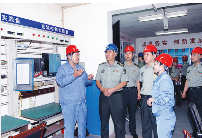
冷轧硅钢厂创新工作室发挥复转军人作用提升员工技能。