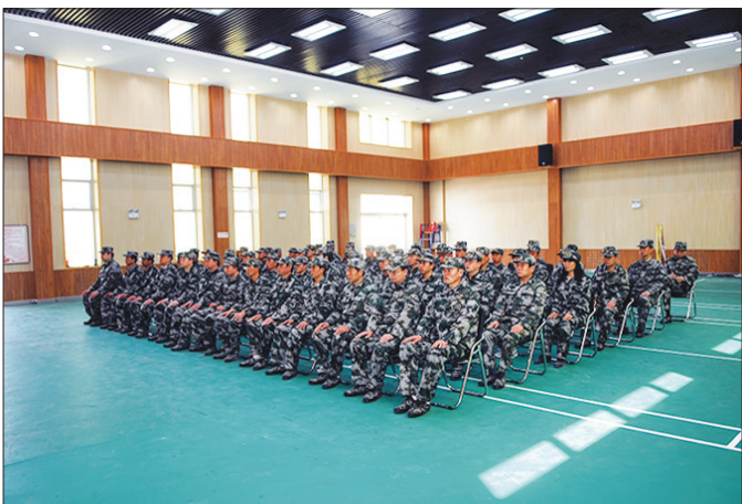
太钢鑫磊公司开展职工全员军事化训练。