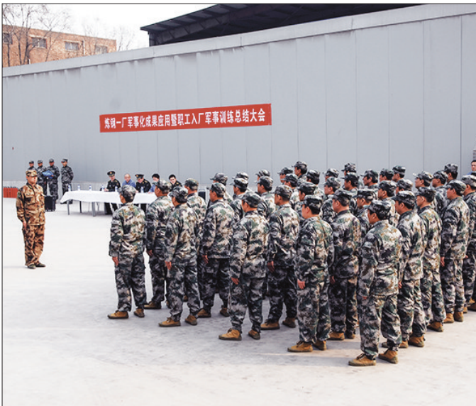
炼钢一厂对临钢援取职工进行军事训练。