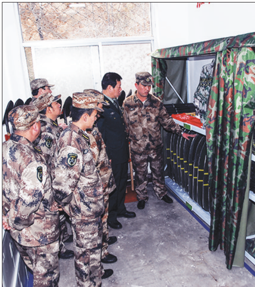
公司武装部组织专武干部到东山矿参观规范化建设。