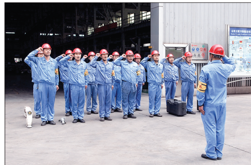
型材厂以军事化成果促安全工作全面落实。