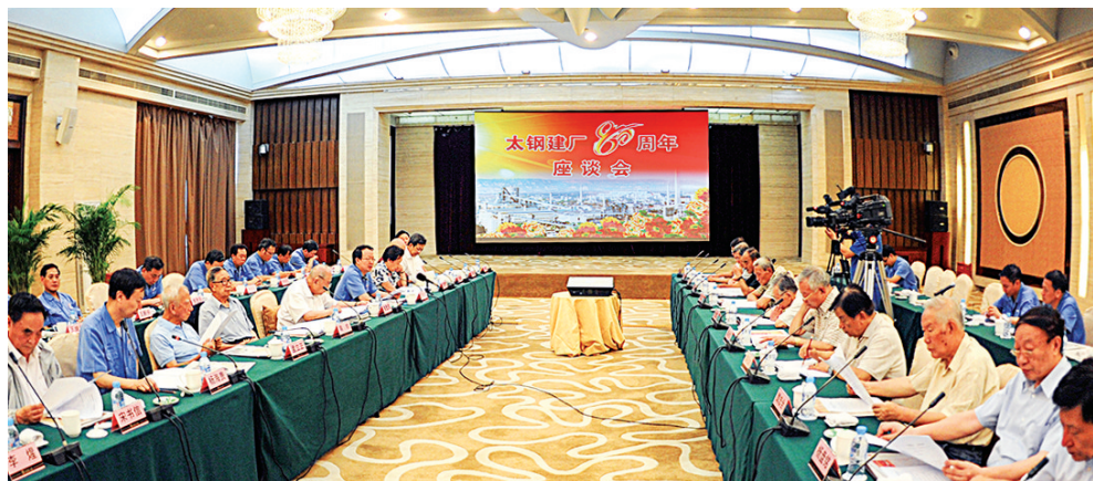
图为座谈会现场。