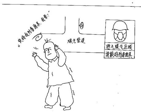
视而不见的后果 张春燕作

“等儿子考上大学就可以享福了;等儿子参加工作了就可以享福了;等儿子结婚了就可以享福了;等孙子上了幼儿园了就可以享福了……”这是一个关于母亲的个人独白,这样的等待,寥寥几言,道出了天下母爱的无私与伟大,体现了母爱一辈一辈无限的传承。