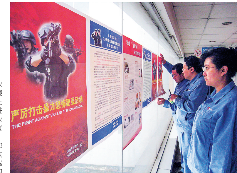
近日,劳务市场根据实际情况,周密安排,严密防范,开展了“反恐反邪教职工治安防范教育”活动,为维护钢城社区平安、和谐、稳定保驾护航。

开展岗位廉洁风险防控摸底排查。根据《矿业分公司廉政风险排查防控工作实施办法》要求,在管理干部和有业务处置权人员中开展了岗位廉洁风险防控摸底排查,针对岗位潜在廉政风险点,组织制定了相应的廉政