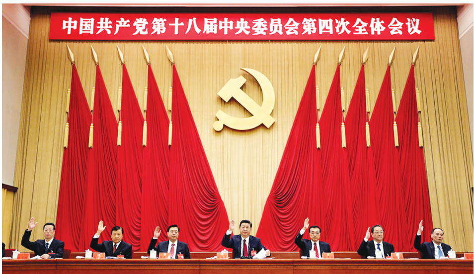
中国共产党第十八届中央委员会第四次全体会议,于2014年10月20日至23日在北京举行。这是习近平、李克强、张德江、俞正声、刘云山、王岐山、张高丽在主席台上。