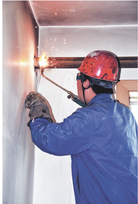
房地产开发公司近期对住户家中陈旧、腐蚀严重的管道管网进行清掏和更换,做好冬季采暖的准备工作。图为职工正在焊接管道。