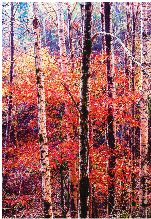
于无声处