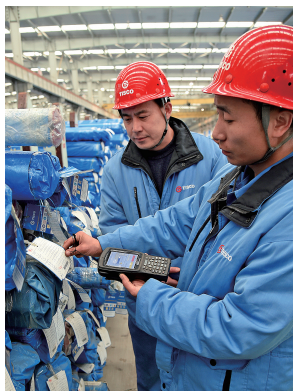
职工在对库内物料进行PDA条码扫描作业。PDA的全面应用大幅提高了库工出入库的效率,缩短了找料出库和发运时间。

不锈钢管公司针对公司“两会”报告提出的“物流劣势”和“劳动效率低下”问题,修补“短板”,结合库区无缝管材质多、规格杂的情况,全方位强化库区成品收拨存日报和ERP系统管理,使库区派车装车程序更加准确、快捷,装车发运效率提高了一倍。