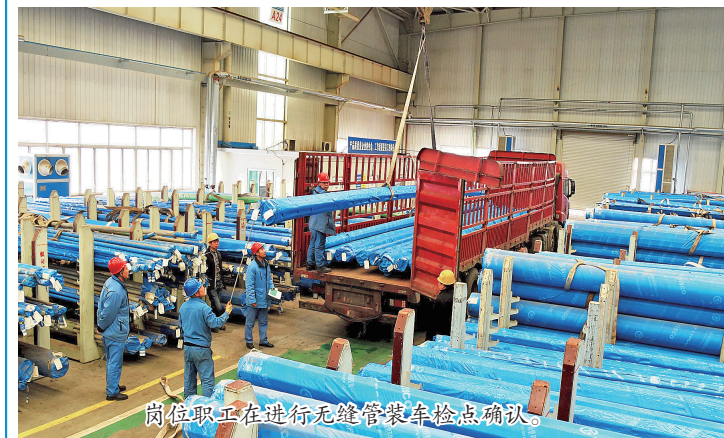
岗位职工正在进行无缝管装车检点确认。