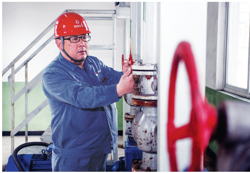
焦化厂开展党员“争优”活动,要求每一名党员立足岗位,增强示范表率意识,发挥好模范带头作用。图为化产作业区党支部党员正在精心操作。薛蕊 文