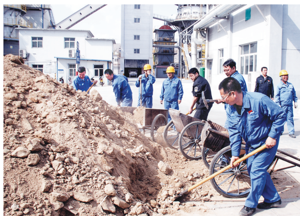
图为劳动现场。邱宝文 摄

烈日炎炎,大家汗如雨下,但是劳累丝毫不能阻挡党员们的干劲。随着一声声号子,一车车土方被平移进绿化带,然后很快被散开摊平。下午七点多钟,40多方黄土填平了绿化区域内的各个坑洼处。随后,党员们又用扫帚把