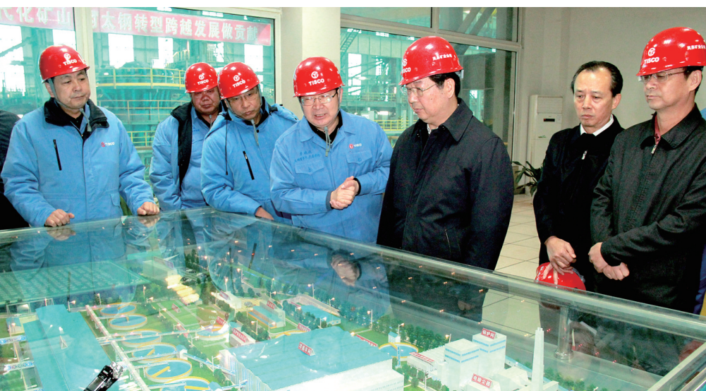
图为省委副书记楼阳生在袁家村铁矿磨磁系统了解生产工艺情况。