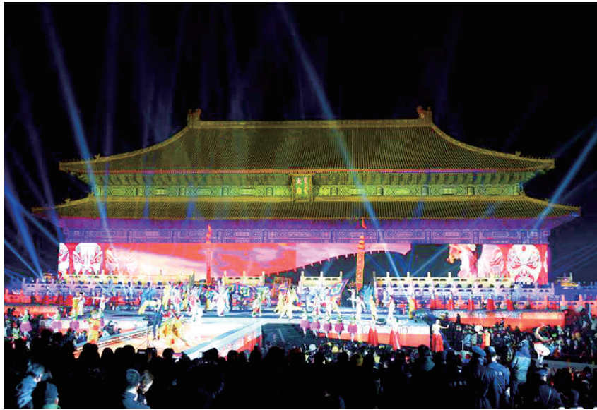
图 片 新 闻

1月1日，以“金色梦想福满京华”为 主题的“2016北京新年倒计时”活动在 北京市太庙举行，吸引了众多市民和中外 游客前来辞旧迎新。