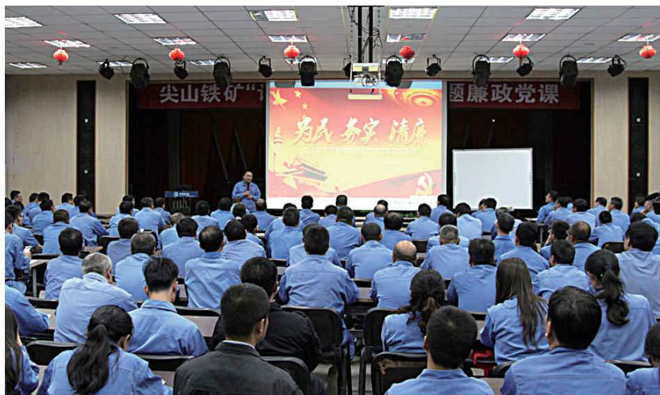
日前,尖山铁矿紧盯节点,为全矿党员干部上党课,要求大家严守中央八项规定,坚决做好节日期间党风廉政建设建设工作。图为党课现场。