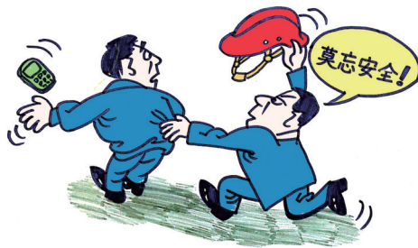
进入现场手机莫带,安全莫忘。王明涛作

通过现场交接班制度进行手机管控,每日白班、二班厂级领导带队,各专业生产部门参加包片区域交接班,通过管理干部检查,对发现的问题点评、督促解决,对现场手机管理出现的问题专门通报。为了消除管控盲区,配备二夜班值班管理干部对现场进行检点,交接班后,第一件事就是由班长先将手机统一集中管理。安全生产技术部不定时对现场手机定置进行检查,发现问题通报考核;综合管理部5S推进室不定时对现场检查,对违反手机定置管理的人员列入月度考核。(张万全)