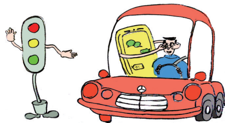
手机违规,安全怎么保。王彤作