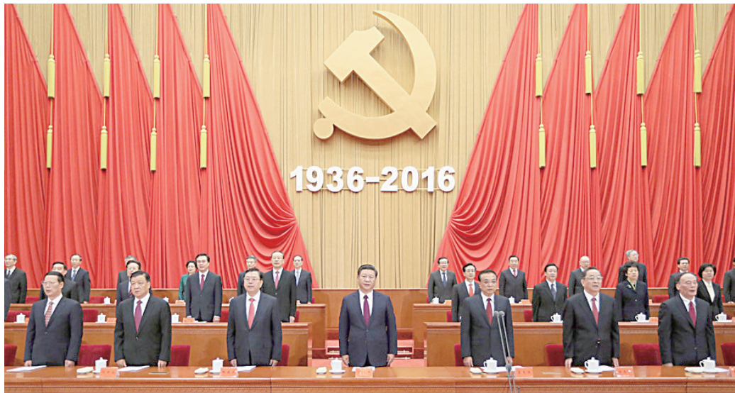
习近平、李克强、张德江、俞正声、刘云山、王岐山、张高丽等出席大会。