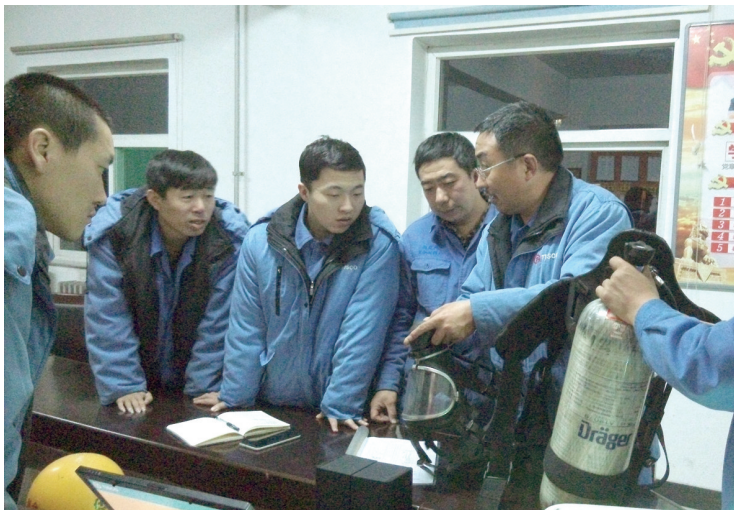
为提高职工应急救援能力,复合材料厂焙烧作业区利用周三安全活动的机会组织职工进行压缩空气呼吸器培训,要求人人亲自配戴过关,使全体职工对压缩空气呼吸器的使用方法有了更加深刻的认识。

但这并不是说我们不去做狭义上的本质化安全工作,相反,我们更应该大力推进这项基础的工作。如果没有基础工作的铺垫,高谈阔论都只能是空中楼阁,毫无根基,不会对安全工作有任何帮助。所以说,严格落实安全制度在任何时候都不能放松,而这也是我们安全工作的一个开始,并不是终点。要达到本质化安全的目的,我们不仅要日常严格执行安全的相关制度,而且要不断加强安全理念的学习,不断提高职工的安全意识,这样才能从职工的内心深处真正把“要我安全”变成“我要安全”,然后发展成“我会安全,我能安全”。