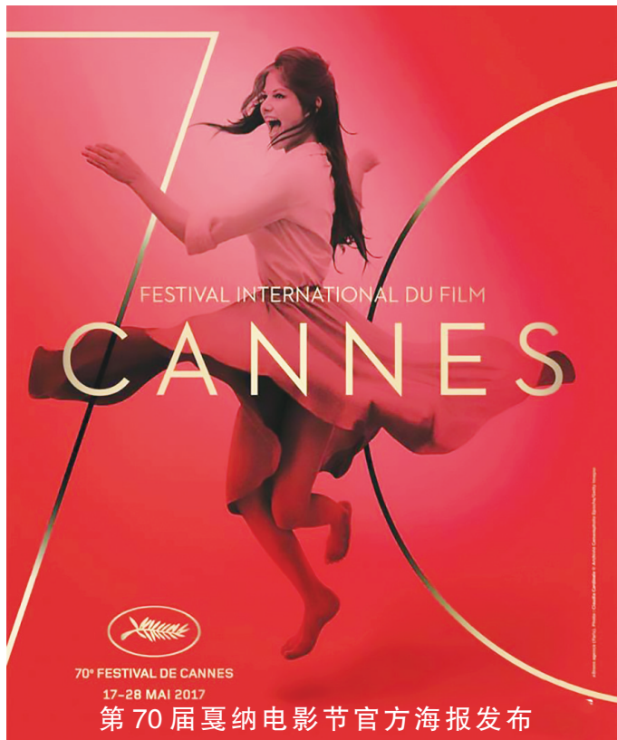
第70届戛纳电影节官方海报发布

记者翻阅天文年历发现，1949年新中国成立至今，清明在4日的有14年，其余均在4月5日。值得注意的是，本世纪没有清明节落在4月6日的时候。