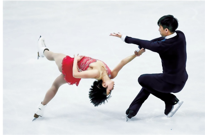
隋文静/韩聪夺世锦赛双人滑冠军