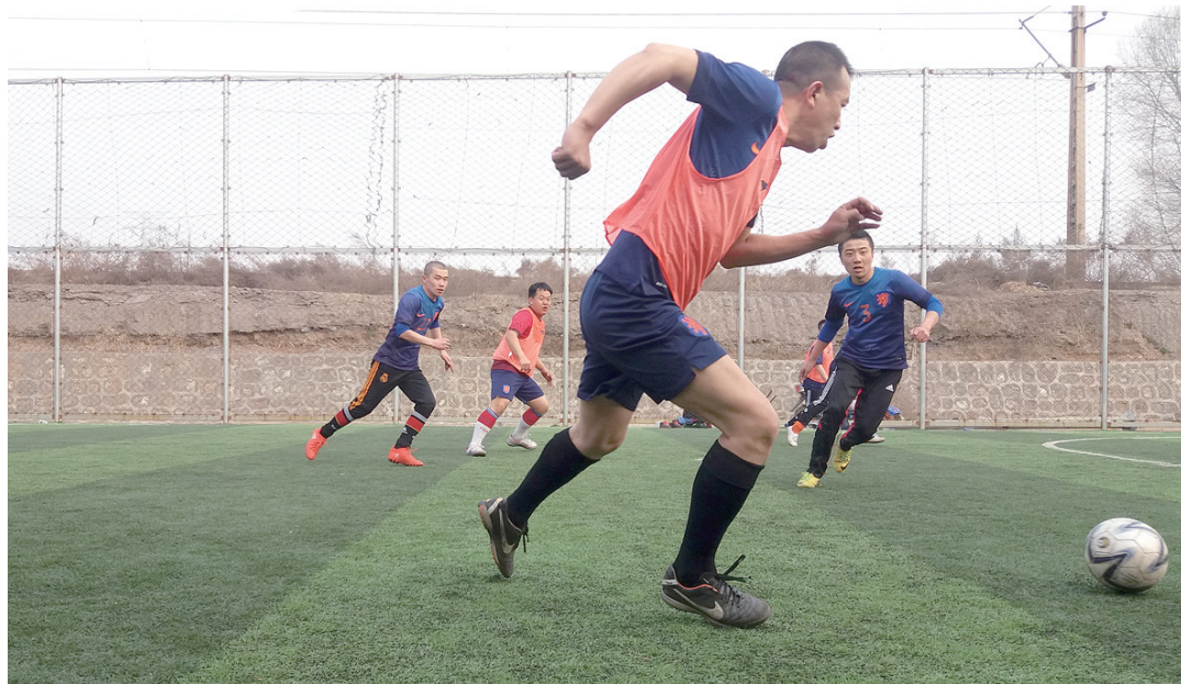
近日,物流中心组织了一场足球友谊赛,比赛中双方球员你争我夺、积极拼抢,充分展现了团结协作不服输的昂扬斗志和顽强拼搏永争第一的比赛精神。图为比赛时的场景。 段晓宇 文

总之,只有进行了激情奋斗的青春,只有进行了顽强拼搏的青春,才会留下充实、无悔的青春回忆。