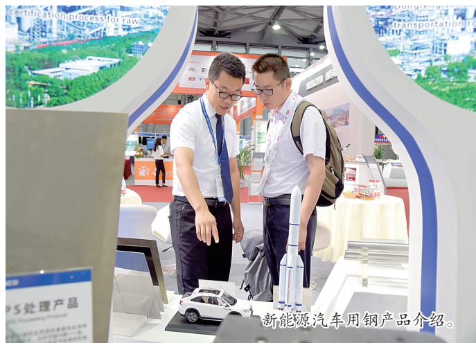
新能源汽车用钢产品介绍。