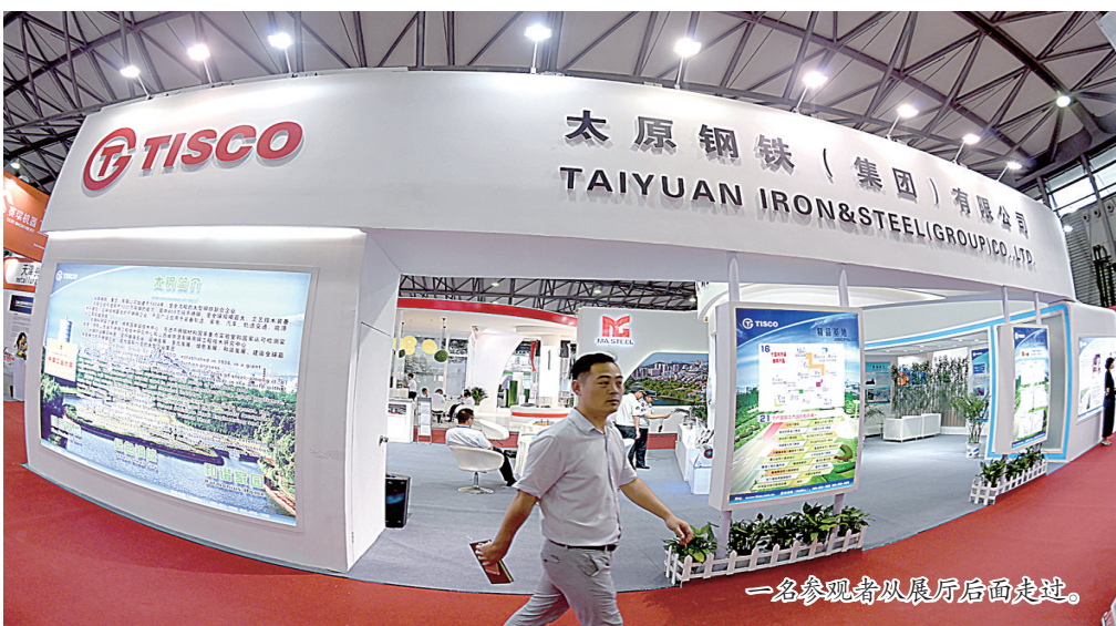
一名参观者从展厅后面走过。