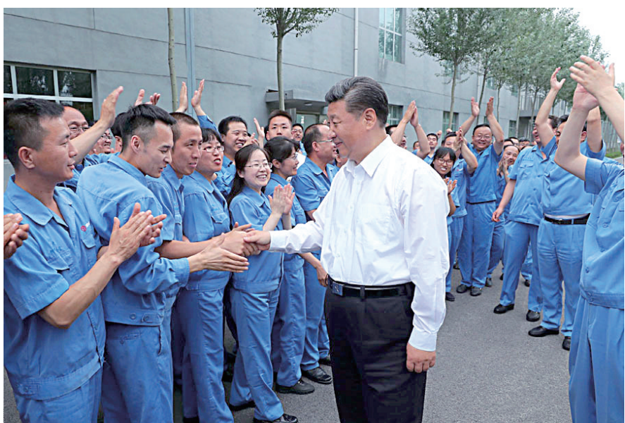
6月22日,中共中央总书记、国家主席、中央军委主席习近平在山西太原考察企业。这是习近平在山西钢科碳材料有限公司同职工亲切交流。

新华社太原6月23日电 中共中央总书记、国家主席、中央军委主席习近平近日在山西考察时强调,召开党的十九大,是党和国家政治生活中的一件大事。各级党委要守土有责、守土尽责,扎扎实实做好改革发展稳定各项工作,为党的十九大胜利召开营造良好环境。