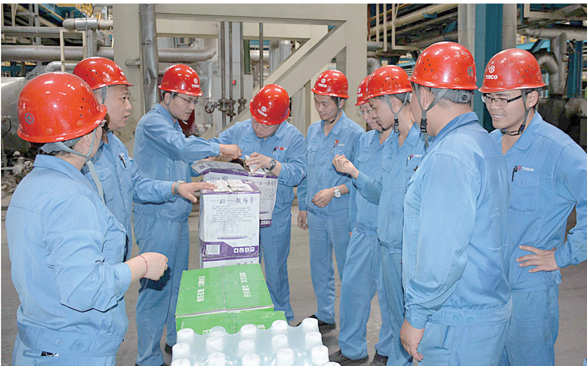
针对近来持续高温天气,冷轧硅钢厂工会为一线高温岗位职工送上盐汽水、酸梅膏、冰菊等夏季饮品,确保职工身心健康,安全生产。图为该厂工会正为一线高温岗位职工发放夏季饮品。

安全是和谐的基石,和谐建设靠大家,每个人都将自己的事做好了,这就是对企业最大的贡献。各位职工齐心协力,我们的家庭、我们的企业乃至整个社会才能和谐发展。