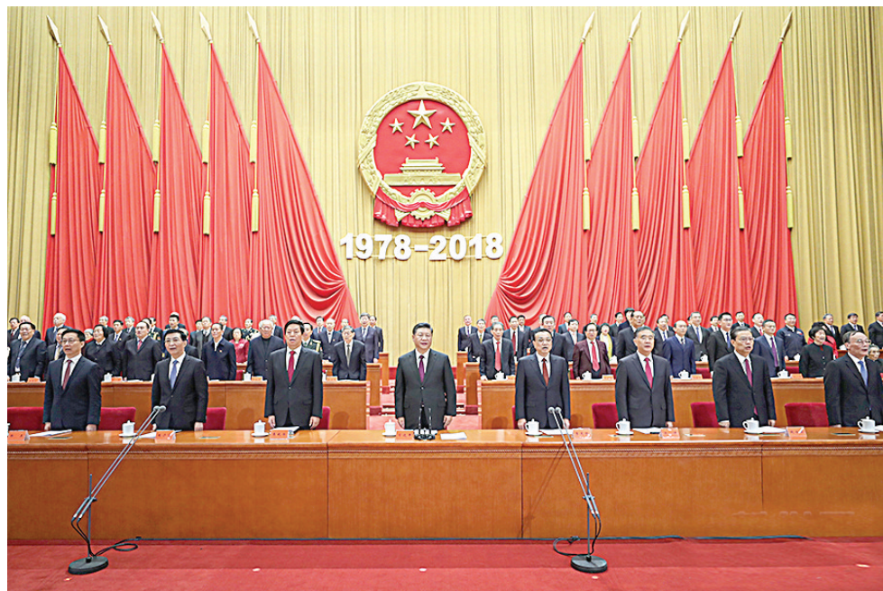
12月18日,庆祝改革开放40周年大会在北京人民大会堂隆重举行。习近平、李克强、栗战书、汪洋、王沪宁、赵乐际、韩正、王岐山等出席大会。

新华社北京12月18日电 庆祝改革开放40周年大会18日上午在北京人民大会堂隆重举行。中共中央总书记、国家主席、中央军委主席习近平在大会上发表重要讲话。