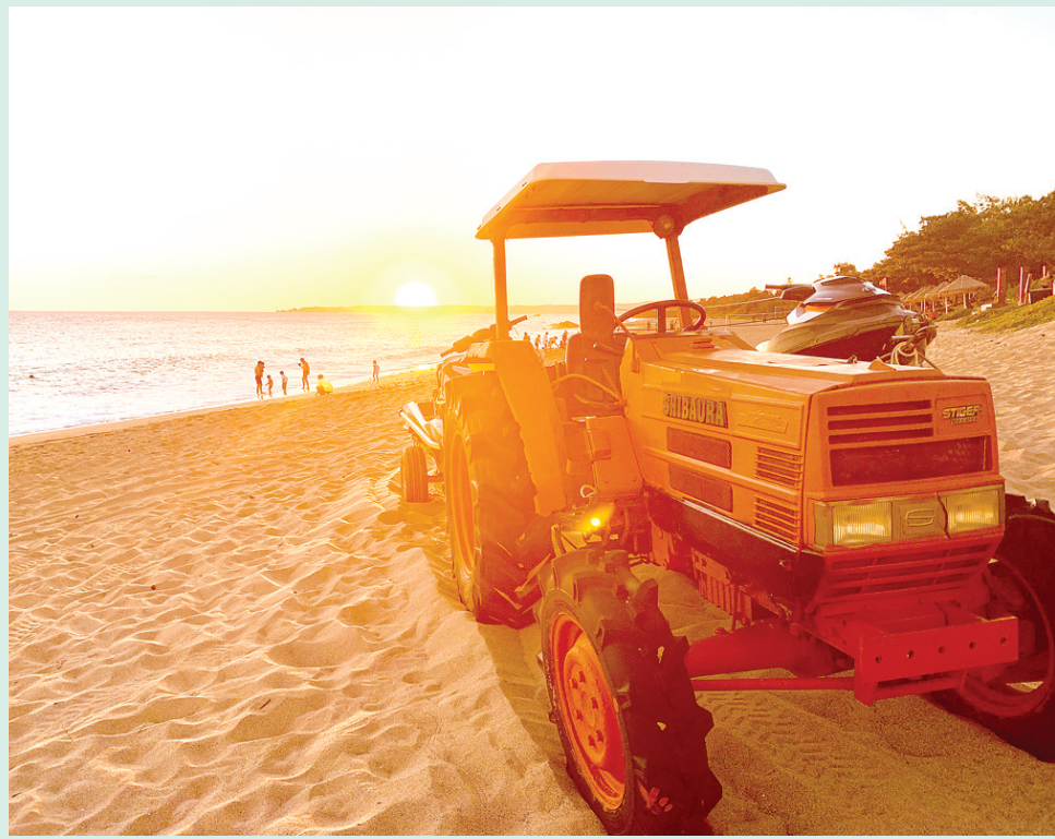
晚霞醉人

我出生在一个农村家庭,记得小时候最高兴的事就是过年,因为只有过年父母才会给我们姐弟买一套新衣服,才会吃上鸡鸭鱼肉和自己最爱的糖果,父亲也会赶上马车拉上一家人去长辈家拜年,与哥哥姐姐玩耍一天都不舍得回家。改革开放,将田地包产到户,每年春种秋收,这是家里唯一的经济来源,家里的菜园承载了家里一年的菜肴,夏秋有新鲜的蔬菜,冬季就是白菜、土豆、萝卜、酸菜、豆子和咸菜。果树上结下的果实也是我们姐弟最期盼的,可以说家里的衣食住行基本上自给自足。