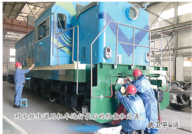
对火炬传递用机车进行最后的检查和完善。