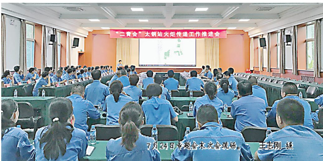
7月24日专题会末次会现场。