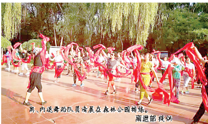
离、内退舞蹈队员清晨在森林公园排练。