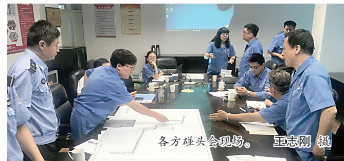
各方碰头会现场。