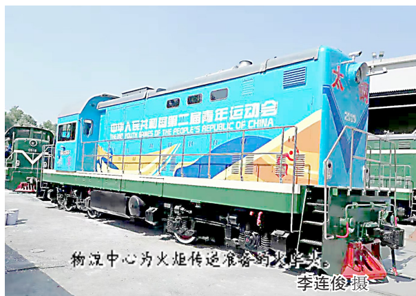
物流中心为火炬传递准备的火车头。