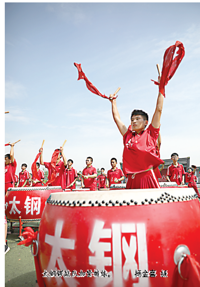
太钢锣鼓队加紧排练。

公司工会在7月24日召开了专题会末次会,会上提出,此次二青会火炬进太钢对实现新时代太钢高质量发展是鼓舞和激励,要进一步提高思想认识,落实责任,坚决守护安全底线,团结合作,确保火炬传递顺利,做到安全、精彩、热烈,通过火炬传递展示太钢的良好形象和太钢人良好的精神风貌。