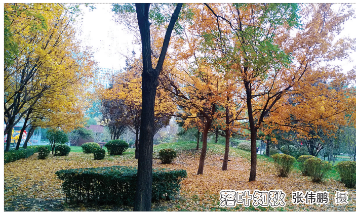
落叶知秋

我们,用她那宽广的胸怀抱大了我们,因为只有“母亲”这个词才能表达我们对祖国最忠诚、最纯洁、最真挚、最深厚、最伟大的情感。作为一名党员,我更应该心系祖国,心系人民,不忘初心,牢记使命,强化责任担当,不断加强党性修养,立足本职岗位,努力做好自己的本职工作,为企业的繁荣强大,贡献自己的一份力量,发出一份光芒。为了我们美丽祖国繁荣昌盛,人民生活更加美满幸福,为实现中华民族伟大复兴梦而努力奋斗!