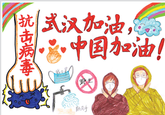
疫情防控 尹建国 作