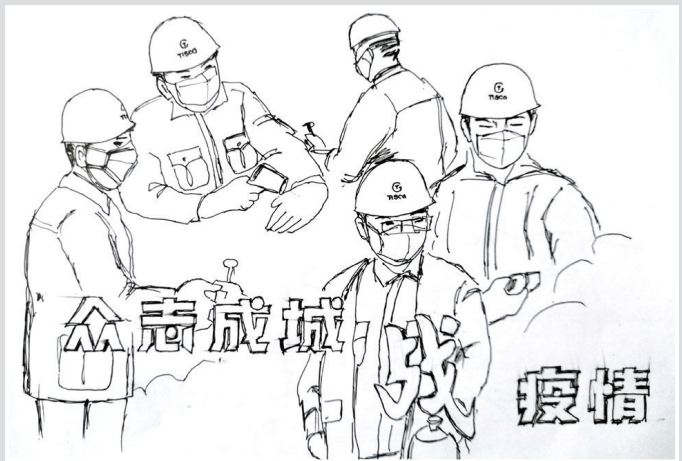
众志成城战疫情 周金海 作