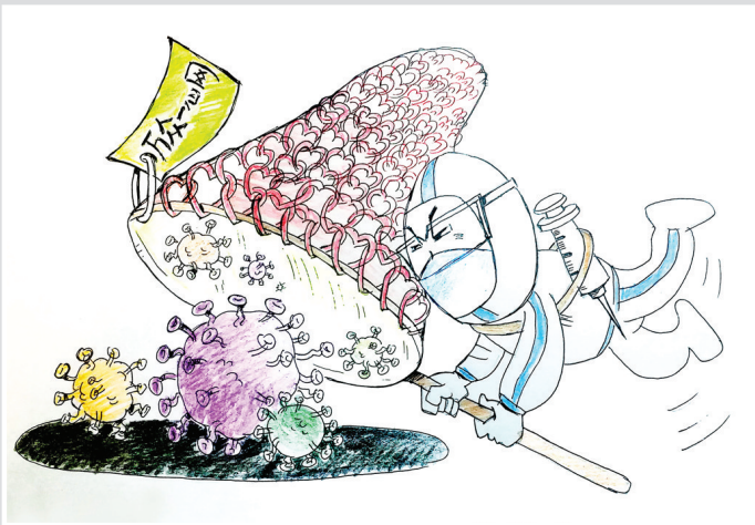
万众一心 赵琦 作