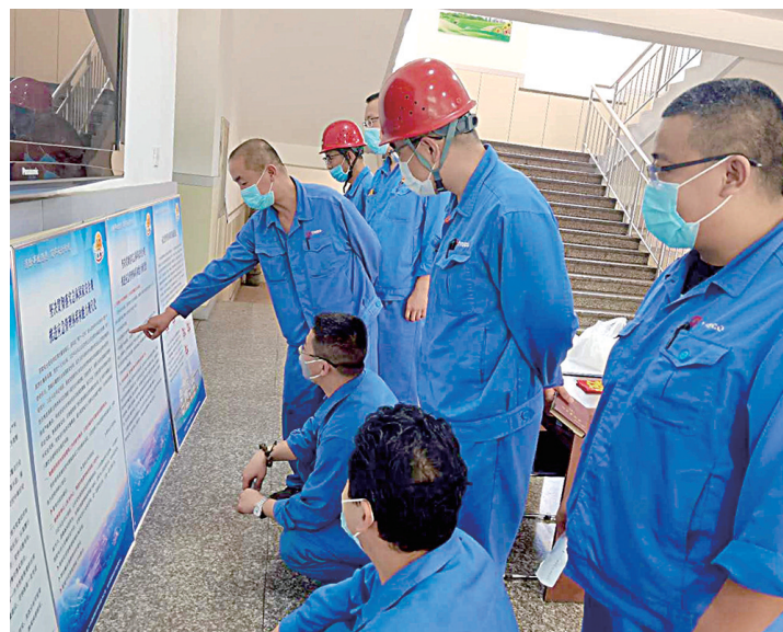
“安全生产月”活动中,炼铁厂通过图板展览、安全书籍发放、安全技能综合竞赛等系列活动,营造安全文化氛围,提高全员安全意识。图为职工正在学习观看安全图板。

有企业高质量转型发展具有重要意义。当前,太钢正处在改革发展的关键期,要从全局出发,进一步加强公司统战基础管理,及时准确掌握人员信息情况,坚持把统战理论和政策培训学习纳入日常工作,有效提升建言献策质量和水平,确保党的统战方针政策得到有效贯彻,最大程度凝聚推动公司高质量发展的强大合力。