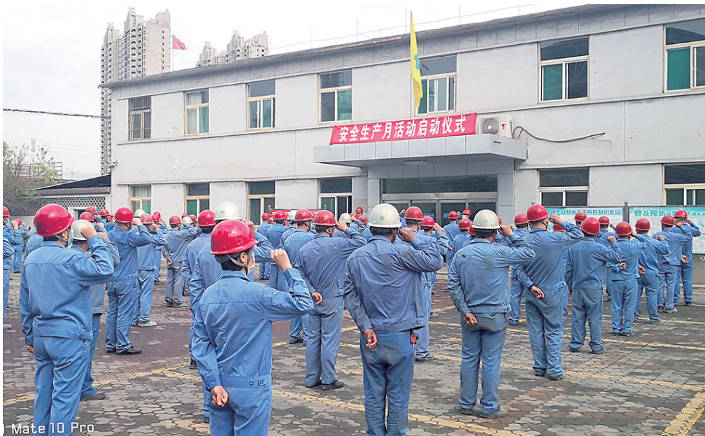
Mate 10 Pro

种方式,发挥正向引导作用,推动“0事故”目标实现。 三是推进企业安全文化建设活动。认真组织疫情防控知识,“七个方面”安全确认要求,十类直观性、习惯性、重复性违章行为,安全理念及安全常识知识的宣传和学习,并利用《电气动态》、微信平台组织开展事故案例警示教育,整改不足;通过组织甄选优秀选手参加集团公司安全故事讲述比赛,安全诗文、格言警句、漫画、微视频征集活动,“网上闯关”学习等教育培训活动,提高职工参与活动的积极性、主动性,增强安全宣传教育效果。