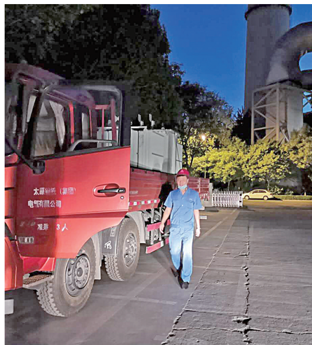
为确保检修人员和重要物资安全送达,电气公司汽车班高度重视,提前开展驾驶员安全培训教育,认真落实车辆“日检”,通过“快”“准”“全”的沟通方式,保障各节点检修任务的圆满完成。截至目前,共完成检修运输任务286次,运输安全率达100%,违章、交通事故率为零。

落实防火责任,夯实安全基础工作。制订了可行的尾矿库森林防火责任书,明确值班干部为尾矿库森林防火现场第一责任人,班前会、周三会必须重点强调尾矿库森林防火;由生产班长牵头组织小型火灾应急处置方案演练,所有职工必须熟知灭火器使用方法,知道森林火警电话,会扑救初起火灾。针对森林防火工作落实过程中上级部门检查发现的问题、提出的意见建议等,进行认真分析梳理,制定整改措施、责任人和落实期限,逐项解决问题,不走过场、不留死角,确保整改落实到位。