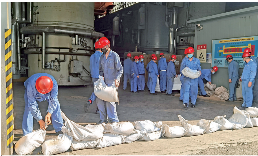
为确保汛期两线生产安全稳定运行,近日,热连轧厂分两线四大班进行了防汛应急演练,人员、车辆、器材在十分钟内到达指定集合地点,做到招之即来,来之能战,战之必胜。图为该厂2250生产线乙大班拉练现场。

上,就评审人员围绕安全基础管理、风险管理、安全绩效等考评元素提出的问题逐项解答。“是否按照规定周期和标准对危险源进行检查?是否按照要求对工器具进行维护、检查、定置、报废、交接及使用?职工对应急处置程序和方法掌握程度是否达到要求?”评审过程严密而审慎,评审人员在查看记录询问基础上,结合现场进行验证,不放过任何一个细节,充分体现了该公司此项工作开展严谨性。正因此,该公司多年来有若干班组荣获各类荣誉,在全矿安全标准化建设中起到了积极的引领作用。如2016年至2018年间,原运输作业区大车一班、现筑运作业区排土场班分别获得由中国安全生产协会颁发的“全国安全管理标准化百佳示范班组”荣誉称号。按照激励政策,不同星级的班组享受的绩效不同,更加激发了各班组创建安全标准化班组的内生动力,进而带动了作业区及全公司安全标准化工作的有力推进。