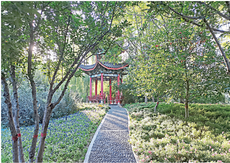
绿荫幽亭

“家人,是比梦想更重要的事情”。即使在外面经历了多大的风浪,只要回到家,就什么都不怕了。因为家,是一个充满爱意、温暖和美好的地方。