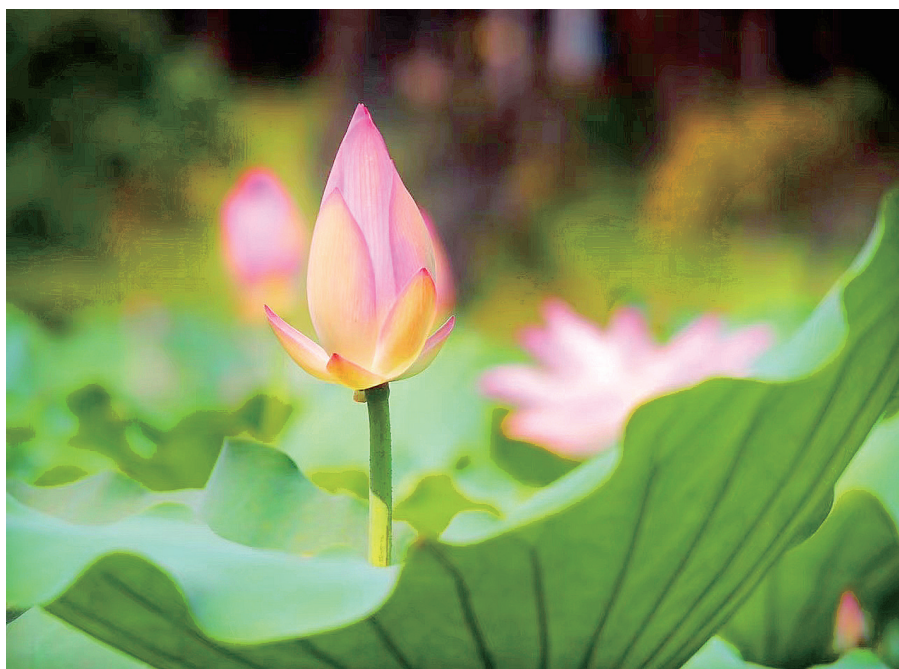
小荷才露尖尖角

白云，这就是我想对你说的：“我想变成你，变成你的纯洁，你的美丽，你无私的美丽。”