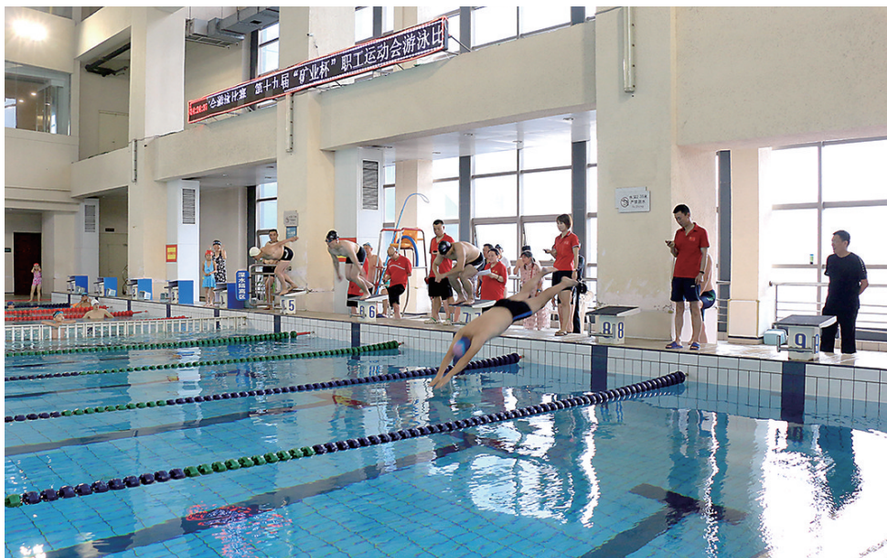
近日,随着游泳比赛项目的结束,由东山矿主办、太钢岚县矿业公司协办的第十九届“矿业杯”职工运动会圆满落幕。运动会期间,参赛职工本着“友谊第一,比赛第二”的原则,勇争一流,奋力超越,展现了昂扬向上、积极进取的精神风貌,进一步丰富了职工体育文化生活,增强了矿山干部职工的凝聚力和向心力。图为游泳比赛现场。

据悉,该中心高度重视此次行动,统筹安排一系列相关工作,主动了解职工需求,广泛听取意见建议,狠抓落实,真正让职工群众看到实实在在的变化,让节约成为全员的习惯和修养。同时,营销中心纪检系统进一步加强监督,通过警示教育、明察暗访等形式,有重点、有针对性的开展监督,在抓“长”和抓“常”上下功夫,建立制度、形成规矩,共同推动形成健康文明用餐方式和勤俭节约风尚。