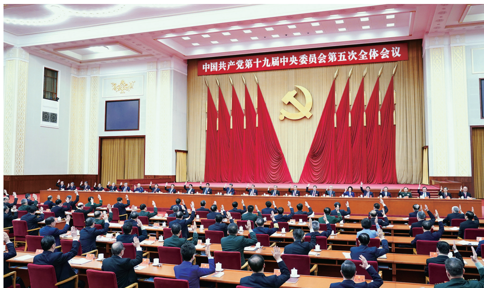
中国共产党第十九届中央委员会第五次全体会议,于2020年10月26日至29日在北京举行。中央政治局主持会议。

新华社北京10月29日电 中国共产党第十九届中央委员会第五次全体会议公报(2020年10月29日中国共产党第十九届中央委员会第五次全体会议通过)