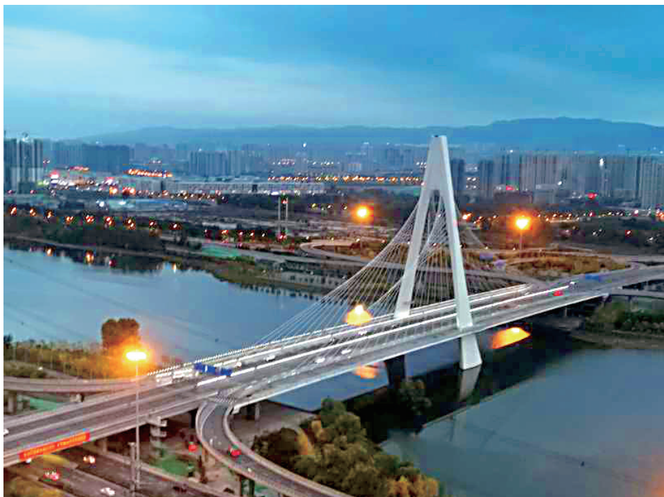
汾河夜色

当浓浓的秋意摘下弯弯枝头上的果香；当辛勤的劳作堆积起打谷场上的金黄；当灿烂的金黄簇拥着田野丰收的喜悦；当清爽的秋风挥舞起漫天的黄叶……谁都会不约而同地品味到秋天的韵味。