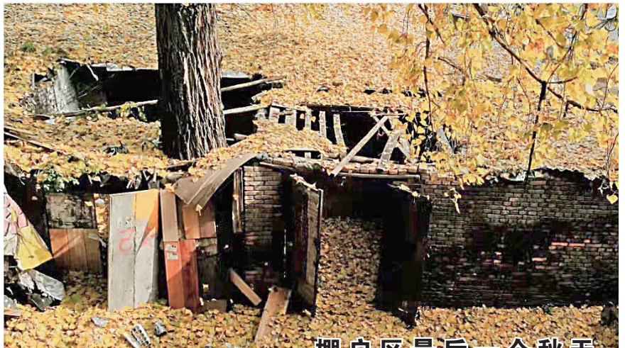
棚户区最后一个秋天