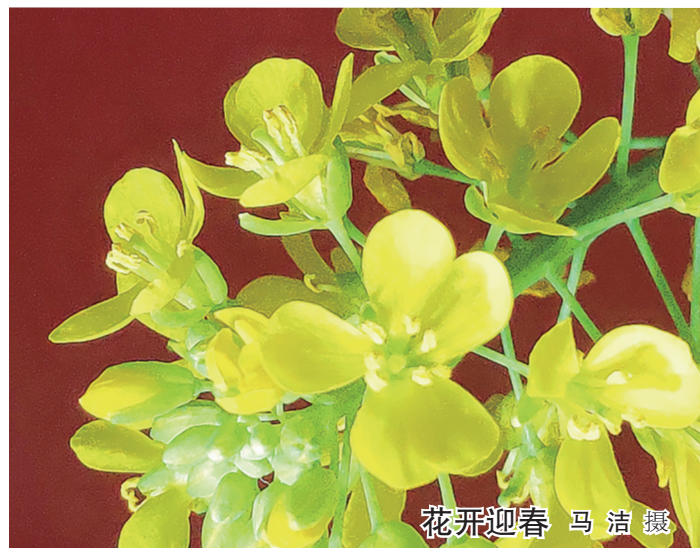
花开迎春

实时通报、对疫情传播途径等常识的认真解读、对疫情防控举措的广泛宣传，筑牢疫情防控的思想防线，认识到“就地过年”与“平安过年”的益处，从主观上认同“就地过年”。就地过年也是一种付出，这种付出同样会被岁月铭记——你和我，曾为这个国家、民族和社会尽己所能，守望相助，与家人短暂的分离，换来平安幸福无疫情肆虐的新年，待春暖花开，疫情退散时，与家人更好地重逢。