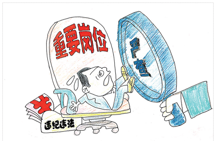
莫伸手 伸手必被捉