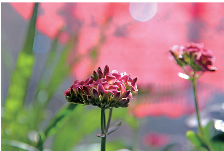
花意 宋明 摄