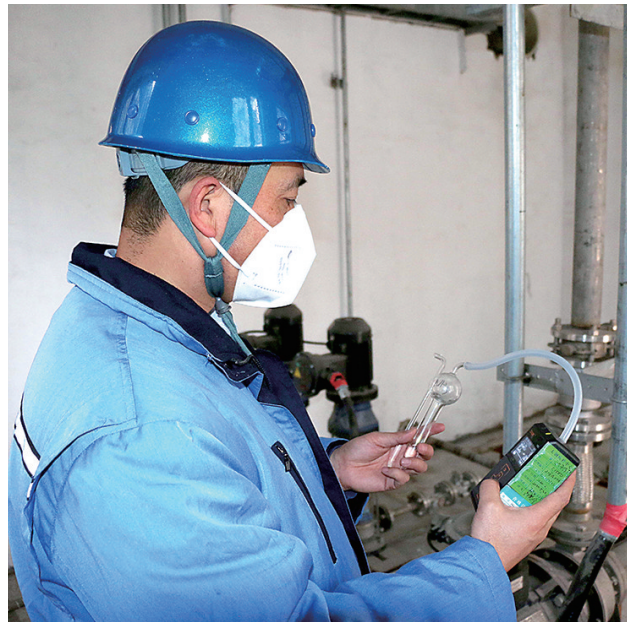
为了预防职业病危害，保护劳动者健康，太钢代县矿业公司坚持“预防为主、防治结合”方针，对有职业危害的场所设施实行分类管理、综合治理，并定期向职工普及职业病防治知识。该公司每季度邀请疾控中心专业人员对全矿粉尘、噪声、有毒有害气体等进行监测评估，依据评估结果认真进行整改，不断提升职业健康安全管控水平。图为疾控中心人员正在对球团超低排放系统氨气站进行监测。