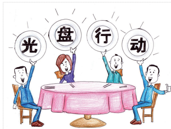
▲ 光盘行动 高志娟 作