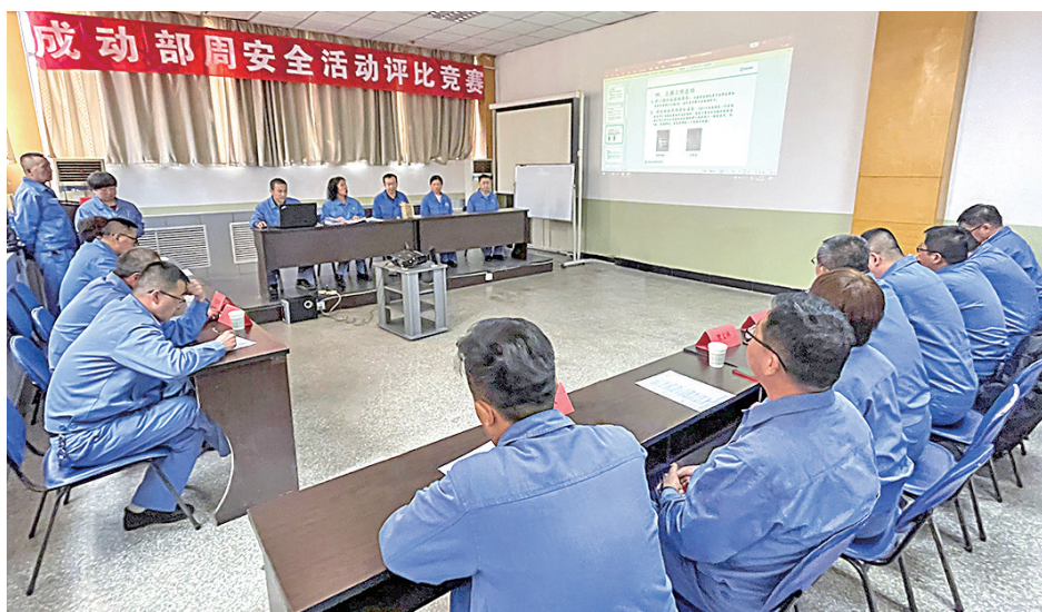
为全面提升职工安全生产意识,让职工在周安全活动中学习进步,提高安全操作技能,有效预防各类生产安全事故的发生,近日,太钢尖山铁矿成品动力部组织开展周安全活动评比竞赛。图为活动竞赛现场。

采购部将严格遵循安全发展理念,弘扬安全至上、生命第一的思想,本着对职工负责、对企业负责的态度,从基础作业抓起,狠抓整改落实,消除事故隐患,让“违章就是犯罪”的理念落地生根,确保安全生产。