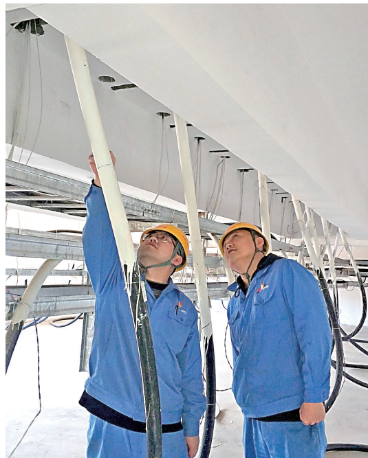
近日,为进一步落实消防安全制度,太钢岚县矿业公司选矿部环水及管输作业区组织开展消防专项检查,及时发现隐患、消除隐患,确保人员安全和生产稳定。图为检查环水电缆夹层。