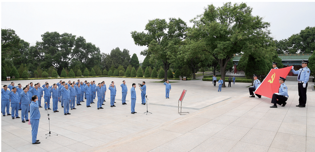
图为重温入党誓词现场。