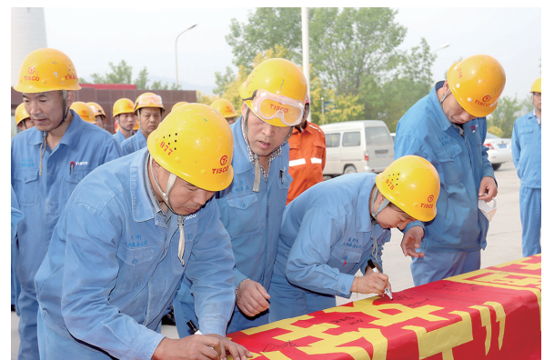
近日,太钢鑫磊公司组织各单位职工、承包方队伍以及当地政府人员开展2021年“安全生产月”活动,认真落实安全责任,推动安全发展。图为安全承诺签字现场。

安全生产管理工作是一项系统工程,安全生产还需要全员、全方位、全过程互动管理。形成党政工团齐抓共管,织实安全联络网,构筑安全管理平台,用一种与时俱进的创新管理理念,营造安全氛围,谱写安全生产新篇章。