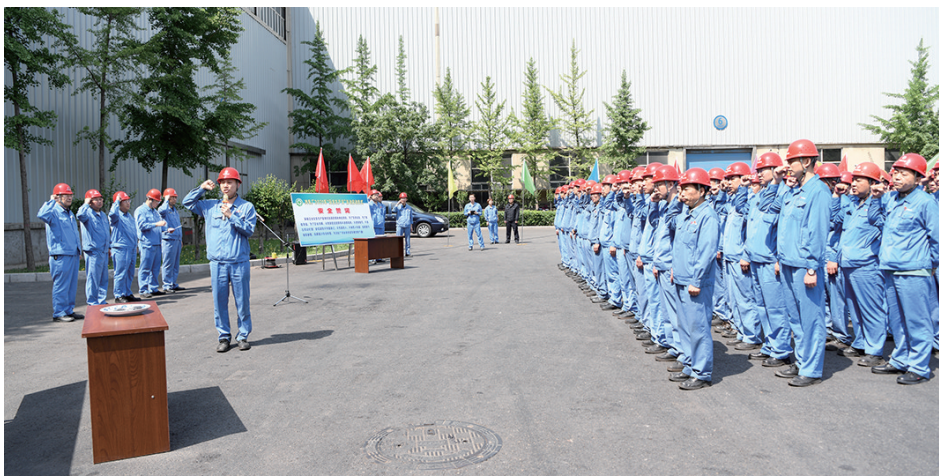
近日,太钢不锈钢冷轧厂认真开展“安全生产月”活动,该厂要求各科室、作业区组织干部职工及承包方人员认真学习中国宝武《安全生产十条禁令》和《典型违章作业行为》、太钢集团《职工生命保障规则》等内容,进一步强化全员“红线”意识,将“违章就是犯罪”理念转化为自觉遵章守纪的实际行动,确保年度安全生产预算指标的圆满完成。