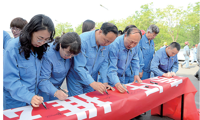
近日,太钢钢管公司认真开展“安全生产月”活动,严格落实2021年度“安全生产月”活动方案,集中学习了典型事故案例,并组织全员进行安全宣誓、签字承诺。图为安全承诺签字现场。

完善应急预案。为应对高温天气可能带来的意外情况,该作业区及时发布相关天气预警信息;各个班组也根据夏季生产特点,制定了相应措施和预案。作业区班子成员严格执行领导带班跟班制度,带班领导重点做好员工行为观察工作,一旦发现中暑症状,尽快安排离岗就医。