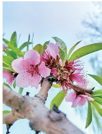
▲ 霞光 桃花朵朵开