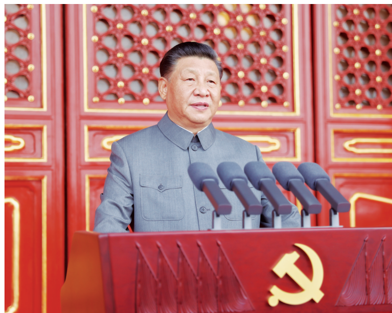
7月1日,庆祝中国共产党成立100周年大会在北京天安门广场隆重举行。中共中央总书记、国家主席、中央军委主席习近平发表重要讲话。