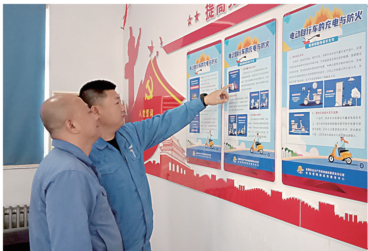
为进一步强化职工安全意识,提升职工安全素质和工作水平,太钢型材厂近日采取多种方式开展安全知识宣传活动。图为该厂精整作业区职工在观看电动车充电与防火宣传挂图。

三是深入推进安全确认专项行动。利用班组安全活动或专门培训活动,强化背诵安全确认“口诀”,并逐条、逐句认真进行解读,以此营造浓厚的安全确认氛围。继续发动职工查找并积极组织消除阻碍、干扰或影响安全确认有效落实的各类不利因素。组织开展“安全红袖章”“事故隐患大扫除”“争做安全吹哨人”活动,观看典型事故警示教育片、以案说法等,引导广大职工深刻汲取事故教训,树牢安全发展理念,增强做好安全生产的自觉性和主动性。