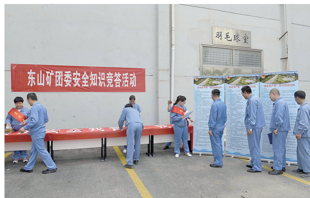
近日,太钢东山矿团委组织开展安全知识竞赛活动,许多职工参与活动,大家在答题活动中增长了安全知识。职工们纷纷表示要从自身做起,为消灭事故隐患、歼灭十类违章,为筑牢安全防线作出自己应有的贡献。图为活动现场。 高爱忠 摄 申热文

安全工作只有起点,没有终点。关注安全就是关注生命,只要我们多一份安全意识,就会多一份安全的筹码;多一份警惕,就会多一把安全的保护伞;多一份安全保障,就会多一份家庭幸福。让我们携起手来,关爱生命,关注安全,让安全永驻心中。