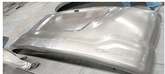
冲压成型的大型挖掘机壳体。